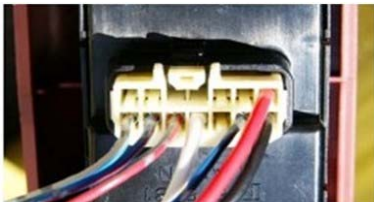
ドアロックアクチュエータ