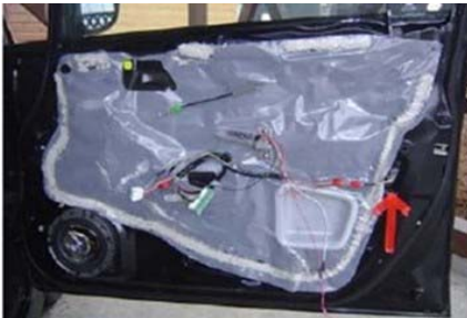
コネクタ2の情報 ドアロックアクチュエータ